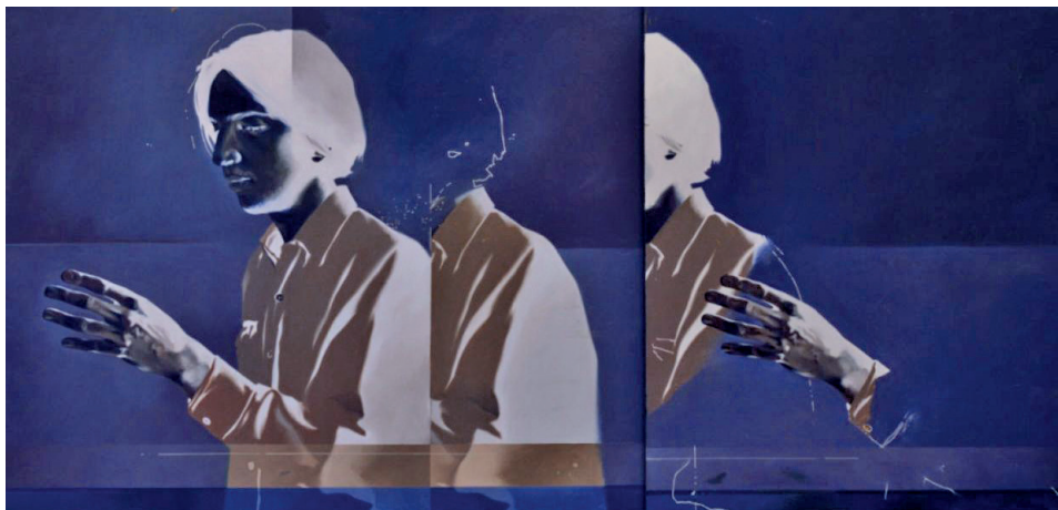
Fig. 3. AI4Culture: una plataforma de inteligencia artificial para el espacio de datos del patrimonio cultural.

Ese desplazamiento trae consigo dilemas de fondo. En primer lugar, la equidad: evitar la discriminación derivada de sesgos culturales o históricos —advertida por los marcos normativos europeos y españoles— y reducir la brecha digital, que amenaza con ensanchar desigualdades entre grandes instituciones y museos locales (UE, 2024; España, 2024; Huang y otros, 2025; Cisneros y López, en prensa). En segundo lugar, el cuidado del vínculo humano: la saturación informativa y la hiperautomatización pueden transformar la visita en consumo de estímulos, debilitando la reflexión crítica y el diálogo social que constituyen la especificidad del museo (Turkle, 2011; Cisneros y López, 2025; Derda y Predescu, 2025). A ello se asocia el temor —recogido por el CES, 2025— de que ciertos usos de IA reduzcan la originalidad y homologuen las prácticas creativas si no median criterios curatoriales sólidos (CES, 2025).