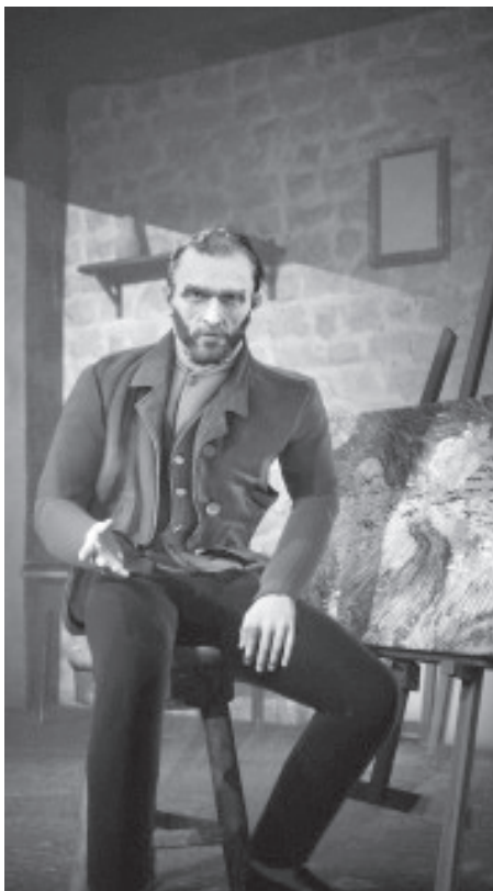
Fig. 1. Hello Van Gogh . La experiencia Hello Vincent es un proyecto de inteligencia artificial generativa conectado con los comportamientos humanos y el lenguaje. Permite interactuar con la inteligencia artificialmente creada del pintor, elaborada a partir de un corpus de unas novecientas cartas en las que Van Gogh habla sobre su vida y su obra. Museo Orly de París.

así la calidad de la experiencia aumentada (Jin y otros, 2021; Li y otros, 2024).