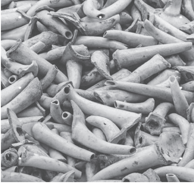
Fig. 1. Boquillas-Spouts (2015), Detalle de la tapa del Catálogo de la exposición Reestablecer Memorias , Ai Weiwei, MUAC, 2019.

imaginación resiste y abre un espacio potencial. Se inaugura el proceso imagético por medio del cual aquellos cúmulos de signos vedados —que también son heridas abiertas— comienzan a conformarse en imágenes.