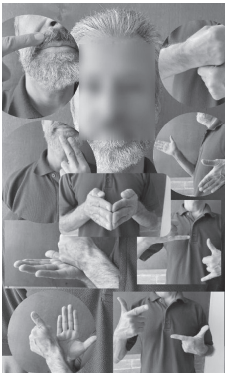
Fig. 4. Narrativa visual en LSC elaborada por sordo adulto mayor participante. Edad 63 años. Collage en lengua de señas, ejercicio visual: ¿Quién soy yo como adulto mayor hoy? Padre, trabajador, amable, correr, crucero, ayudar, jugar, habilidad, luchar.

En relación con este aspecto, se observa que todos provienen de familias de oyentes, lo cual ha impactado en cada uno de ellos, porque afirman que la relación que tienen con sus familias es muy básica; la mayoría de los miembros no aprenden lengua de señas, lo cual dificulta tener una adecuada y profunda relación y comunicación. Establecen un código propio que les permite hacer intercambios comunicativos mínimos, algunos afirman que sus hermanos aprenden la lengua y es a través de ellos por lo que logran intercambiar información de las diferentes situaciones familiares. Destacan que cuando tienen hijos que en su mayoría son oyentes, aunque creen que van a tener mayor comunicación al enseñar a sus hijos la lengua de señas, no en todos los casos es así, ya que de niños la comunicación y relación con los hijos es más visual y comportamental, luego, al crecer, en su gran mayoría la comunicación es básica.