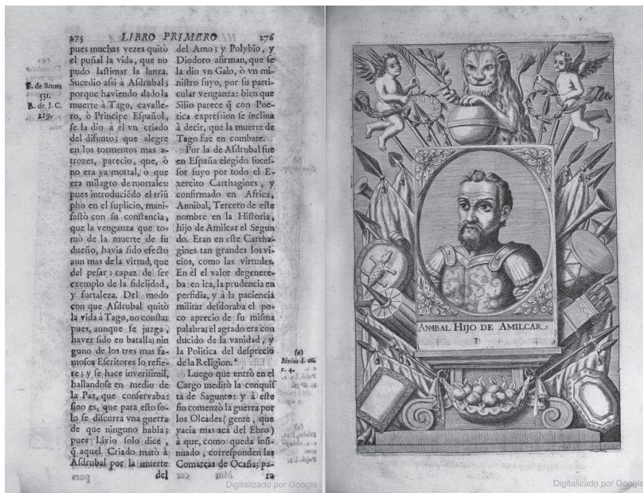
Fig. 2. Historia de España vindicada .

del recurso de la profecía, lo que es su argumento central: la historia institucional de la ciudad, que se prolonga hasta el presente de Peralta, desarrollada como un extenso catálogo de dignatarios laicos y eclesiásticos y noticias diversas. Lima fundada incorpora, entre otras, noticias sobre terremotos y levantamientos indígenas. 22