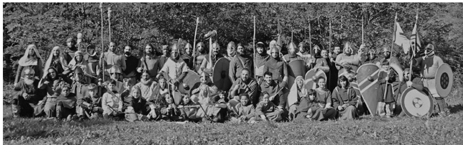
Figura 9. Normandos al servicio de Ermessenda. Algunos recreadores y reconstructores históricos junto a alumnos de la escuela Waldorf de Vallgorguina.

que participó en la recogida de datos fueron, en este orden: 1) la reconstrucción histórica (y la correspondiente visita guiada) de la cabaña del siglo XI; 2) la teatralización de la batalla del puente, 3) los oficios realizados por los artesanos, destacando entre ellos, quizás por su novedad en la programación, la demostración de fundición y elaboración de joyería histórica (reproducciones), 4) el taller de elaboración de velas con cera natural de abeja y 5) el taller de acuñación de moneda (cristiana y andalusí).