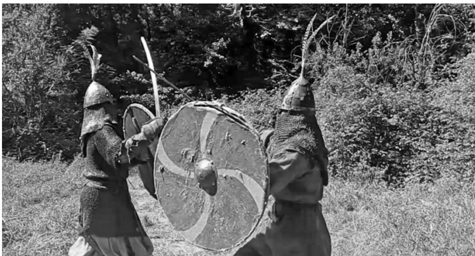
Figura 6. Recreación y reconstrucción históricas ( storytelling ). Fotografía: Laura Jiménez Martínez (2019).