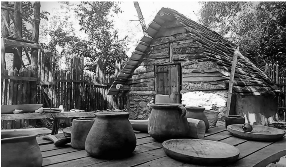
Figura 7. Reconstrucción de estructura habitacional del siglo XI a cargo de Gesta Regnorum .