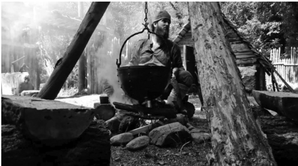
Figura 3. Recreación y reconstrucción históricas. Taller de cocina medieval.

pintura mural del primer románico catalán o el Tapiz de Bayeux. 35 Otros modelos se obtuvieron a partir de ejemplos de artes suntuarias, como la arqueta-relicario de San Millán de la Cogolla y otras muchas fuentes materiales (figura 3). 36