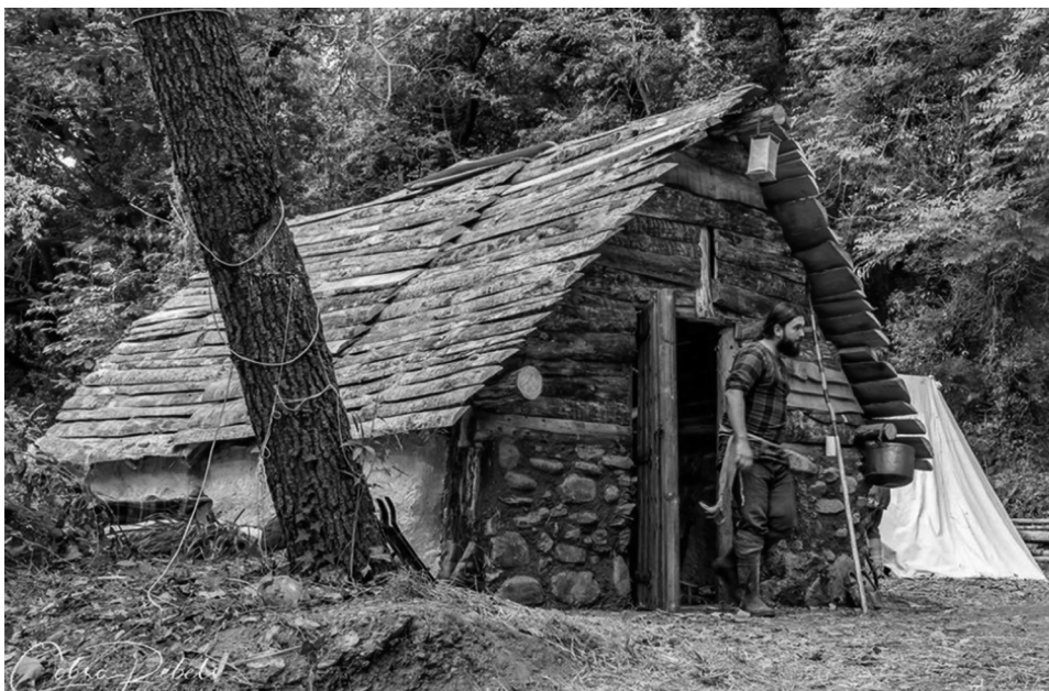
Figura 8. Reconstrucción de estructura habitacional del siglo XI a cargo de Gesta Regnorum .