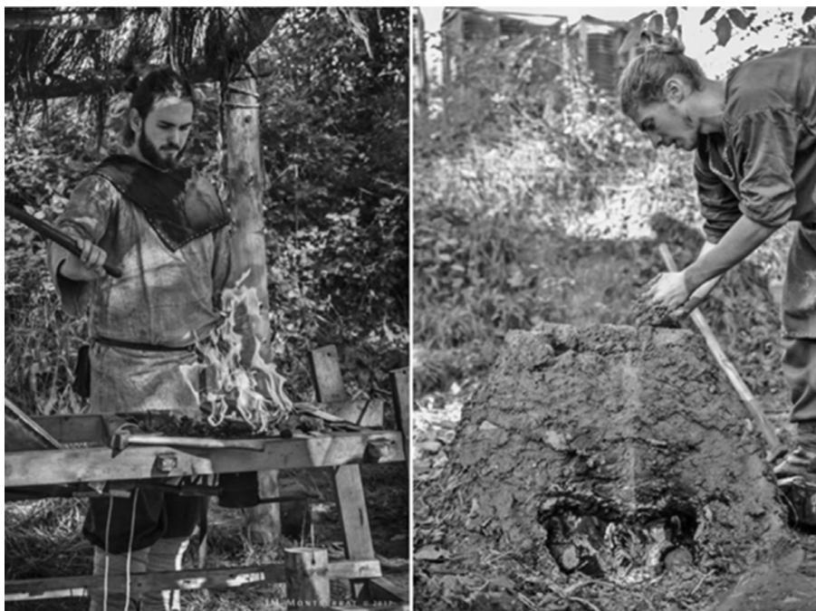
Figura 1. Demostración del trabajo de forja tradicional y taller de arqueología experiencial (reconstrucción y puesta en funcionamiento de horno de adobe para la cocción de cerámica).