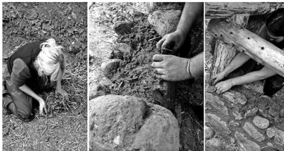
Figura 2. Desarrollo de la construcción de la casa elemental. Elaboración de adobe y levantamiento de muro de piedra en opus incertum .

grubenhäuser se llevó a cabo a través de una metodología basada en la arqueología experimental, empleando materiales de la zona y madera reciclada, para evitar el impacto medioambiental. 32