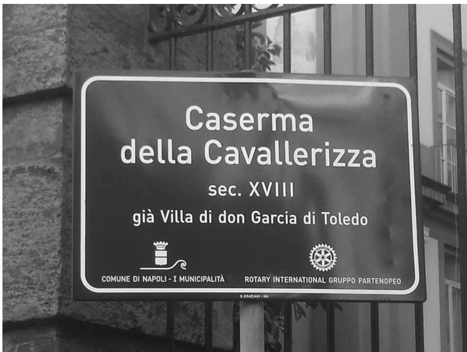
Figura 2. Cavallerizza di Napoli ora occupata da una Scuola.

Nel 1465, in occasione del matrimonio di Ferrante con la cugina Giovanna, sorella di Ferdinando il Cattolico, ebbe luogo una splendida giostra in piazza della Sellaria, descritta dal cronista Giuliano Passaro, che si sofferma sulle bardature di cavalli e cavalieri e sul destriero del duca di Calabria “... un cavallo che andava all’aria con li salti (cioè che conosce la posada) e poi rompio quattro lanze indorate molto degnamente...”.