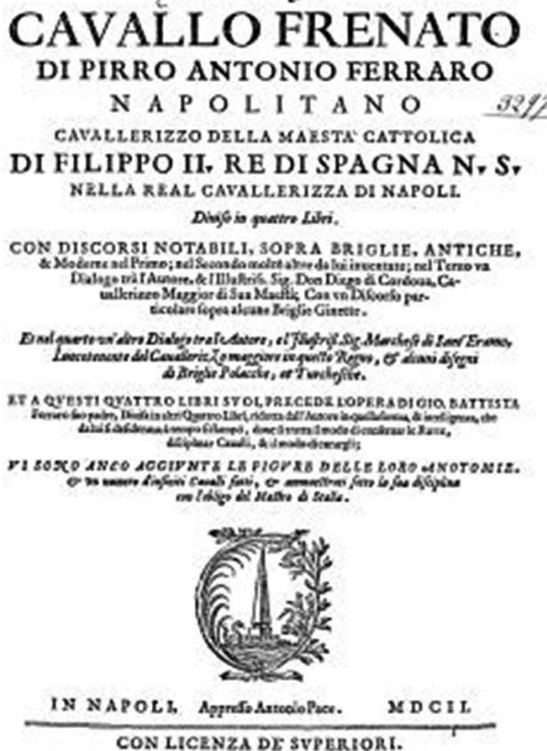
Figura 5. Frontespizio del libro di Antonio Pirro Ferraro, Cavallo Frenato , 1602.

Pignatelli si basò su questi insegnamenti e su quelli degli spagnoli per rendere efficace un suo metodo personalizzato. Lo stesso de Pluvinel amava sempre ricordare il proprio Maestro dicendo che il “ cavaliere doveva essere avaro di colpi e prodigo di carezze ”.