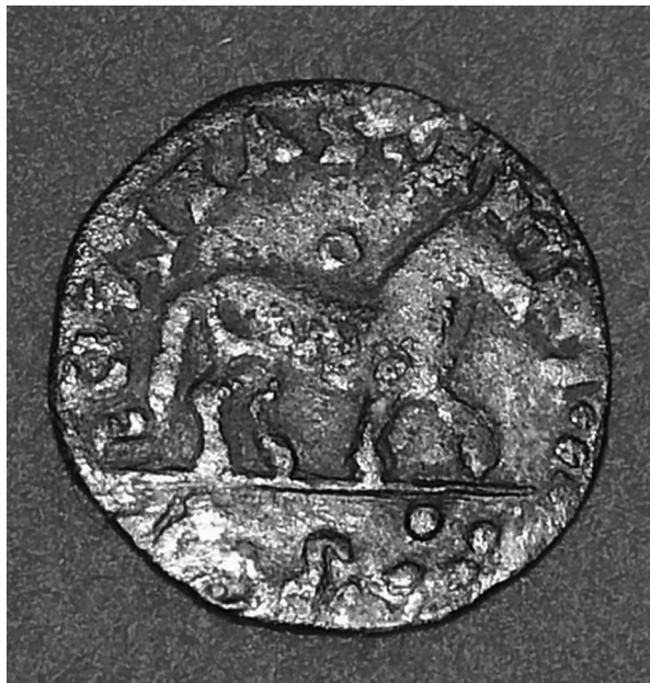
Figura 1. Moneta Il cavallo coniata da Ferrante d'Aragona nel regno di Napoli nel 1470.

“splendissima cavalcata” di quattrocento corsieri di grande statura e bellezza, “fatti et ammaestrati a tutto ad ogni presto maneggio” .