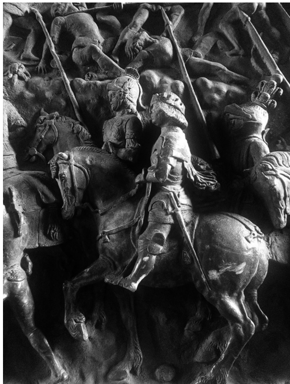
Figura 3. Dettaglio del Portone Bronzeo del Maschio Angioino. Ferrante d'Aragona.

Gonzaga ad esempio, erano di frequente a Napoli con i propri emissari per ricercare i maggiori soggetti. 8