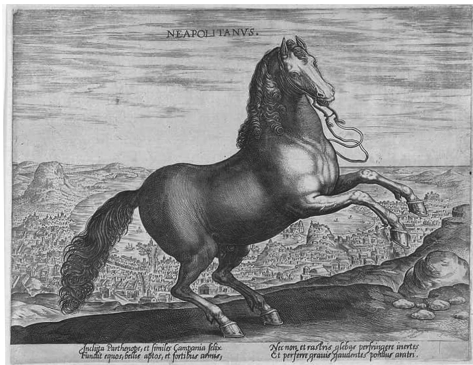
Figura 6. Stampa di un Cavallo Napoletano. Philips Gille, 1582.

cisione nel maneggio delle armi e del cavallo. In caso di combattimento gli avversari giostranti erano soltanto due, in «singolar tenzone» o «battaglia singolare»: lo scopo dell'esercizio, che talvolta poteva consistere in una serie di scontri armati, anche a piedi, corpo a corpo, si risolveva in genere col disarcionamento dell'avversario, vale a dire con una conclusione che escludeva, salvo per accidentale fatalità, la sopraffazione cruenta dell'avversario. 22