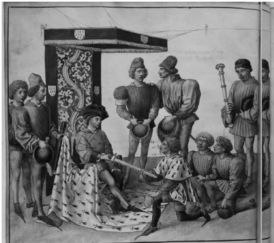
Figura 7. Dettaglio del Libro dei Tornei del Redi Napoli Renato d'Angiò, xv Secolo.

Nel settembre del 1477, un nuovo evento impegnava la Napoli aragonese: le seconde nozze di Ferrante con Giovanna d'Aragona. I festeggiamenti si concluderanno con una Giostra, il giorno 18 Settembre, alla presenza della coppia reale, il cui cronista viene colpito dalla lussuosità delle armature, delle vesti dei giostratori e delle bardature dei cavalli: