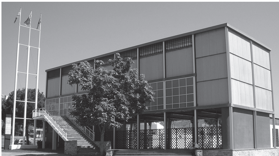
FIG. 23. CRAI Biblioteca del Pavelló de la República de la Universitat de Barcelona.

En cuanto al archivo, ocupa más de 500 metros lineales, consta de aproximadamente 220 fondos documentales, organizados en función de unas series generales, unas series particulares y un conjunto de colecciones. Trata de personas, organizaciones políticas y sindicales, y entidades diversas que protagonizaron diversos episodios históricos del siglo pasado.