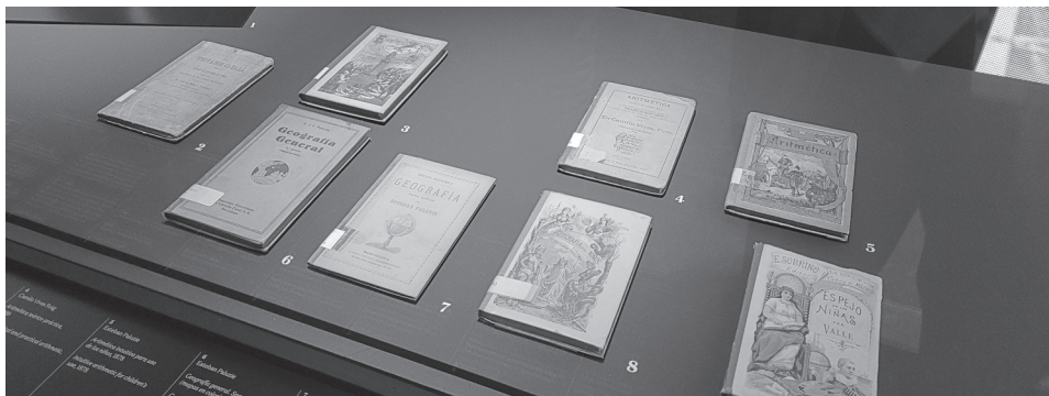
FIG. 25. Libros de la colección del CRAI Biblioteca Pavelló de la República, en la exposició: Educació en llibertat (El Born Centre de Cultura i Memòria, 8/4/2021-24/10/2021).