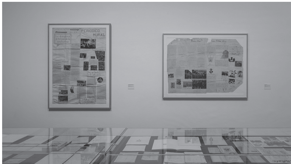
FIG. 24. Periódicos murales (1937) del CRAI Biblioteca Pavelló de la República, en la exposición: Francesc Tosquelles. Como una máquina de coser en un campo de trigo (MNCARS, 28/8/2022-27/3/2023).