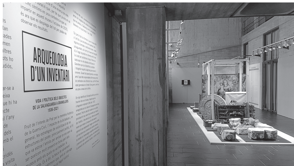
FIG. 4. Imagen de la exposició Arqueologia d'un inventari. Vida i política dels objectes de la salvaguarda a Granollers 1936-2021.