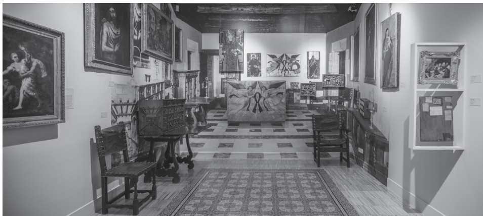
FIG. 5. Imagen de la exposición Expedient 2619. Art en dipòsit. Mataró 1936-2023. Ca l'Arenas-Museu de Mataró.