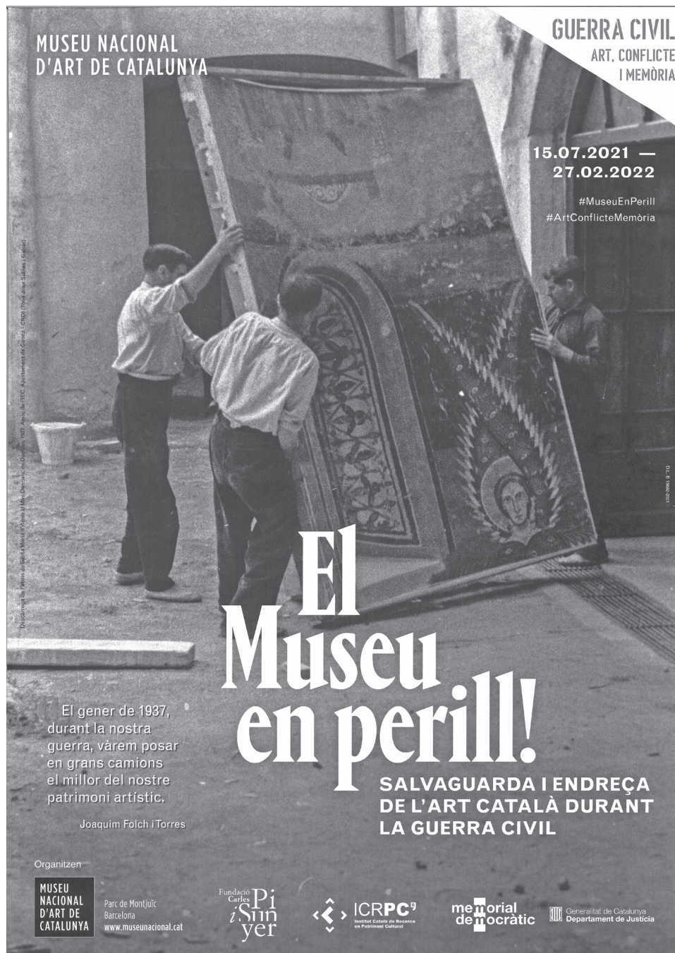
FIG. 3. Cartel de la exposició El Museu en perill! Salvaguarda i endreça de l'art català durant la Guerra Civil .