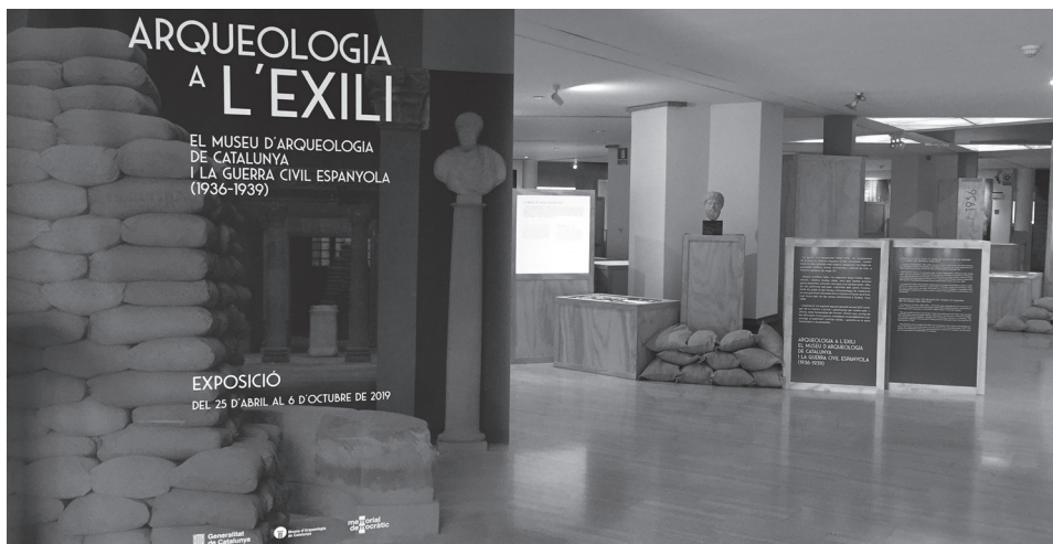
FIG. 2. Entrada a la exposició Arqueologia a l'exili: El Museu d'Arqueologia de Catalunya i la Guerra Civil espanyola.

la derrota republicana. Arqueologia a l'exili: El Museu d'Arqueologia de Catalunya i la Guerra Civil espanyola (1936-1939) se presenta como una reivindicación de la propia historia del museo (fig. 2). Parte de su propia creación, en 1932, fruto del proyecto republicano de transformación museística en Cataluña, y muestra cómo la Guerra Civil irrumpe en la vida del nuevo museo. En 2019 la evacuación y periplo de las colecciones del Museu d'Art de Catalunya (actual Museu Nacional d'Art de Catalunya) y de las obras incautadas allí concentradas era una historia bien conocida, en cambio, las vicisitudes ocurridas en el MAC lo eran mucho menos.