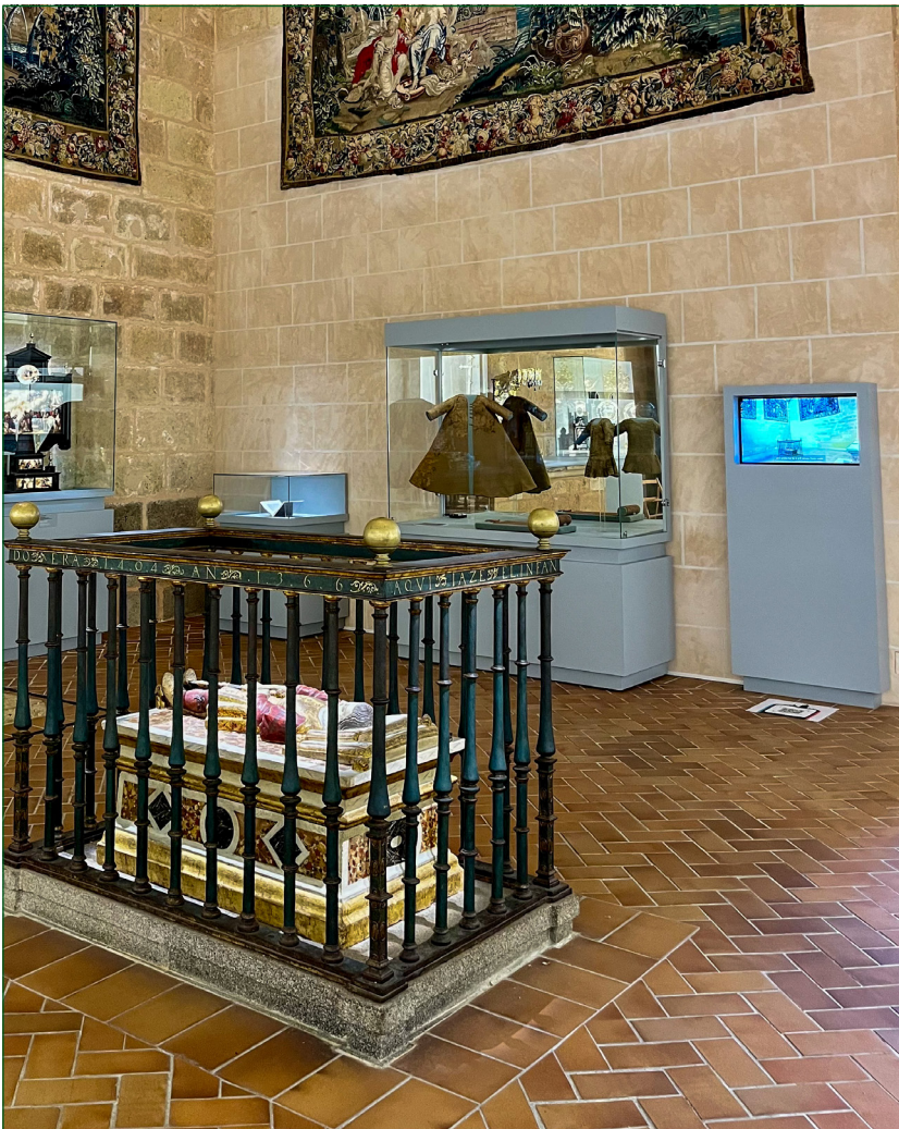
Figura 4. Ajuar de don Pedro Enríquez en la Catedral de Segovia.

soportes invisibles tal y como se aprecia en la museografía del ajuar de Teresa Gil en Oña (Figura 5), excepto el caso de Caleruega que se exhibe en plano, con cartelas explicativas relacionadas con información sobre la pieza y su proceso de recuperación.