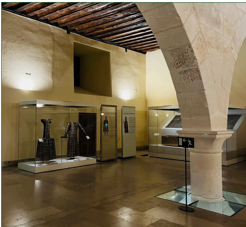
Figura 3. Museografía actual del Museo de Telas Medievales.

Siguiendo el caso de Huelgas, la tendencia de las últimas décadas ha sido de conservar los ajuares en las iglesias y monasterios, donde se ubican los sepulcros exhumados, la mayoría en pequeños municipios. En 1968 se restauró la aljuba del príncipe García (1142-1146), hijo de Alfonso VII de León «el Emperador», ubicada fuera de su sepulcro en la iglesia parroquial de San Salvador de Oña en Burgos, a causa un expolio sufrido en el siglo XIX. En 1996 se recuperaron las piezas textiles del sepulcro de la infanta María (c. 1235), hija menor de Fernando III el Santo (1199-1252), enterrada en el Panteón Real de la Colegiata de San Isidoro de León. Sin embargo, han estado guardadas hasta diciembre 2023, cuando han entrado a formar parte del nuevo proyecto museográfico del Museo de San Isidoro de León (Fundación Montemadrid, 2023). En 2001 se recuperó el ajuar funerario de Teresa Gil del siglo XIV del Monasterio de Sancti Spiritus en Toro, Zamora (Descalzo, 2008) y se expone en el monasterio como parte de su colección museística. En Agramunt, Lérida, se conservan prendas de un sepulcro datado del siglo XIV, único conjunto anónimo y que no pertenece a las altas esferas castellanas, probablemente perteneciente a la nobleza local y el más antiguo conservado en Cataluña (Cerdà, 2013).