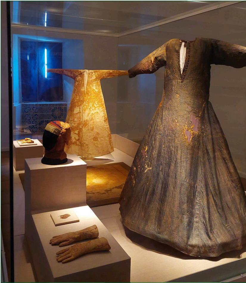
Figura 5. Vitrina perimetral que exhibe el ajuar Teresa Gil en el Monasterio de Sancti Spiritus de Toro.

traje. Dicha dispersión se complica al tener en cuenta que algunos de los ajuares se encuentran en lugares más remotos y que su alcance es más limitado, como es el caso de Toro, Oña o Caleruega. Esto puede generar problemas de accesibilidad y conocimiento por parte de un público amplio.