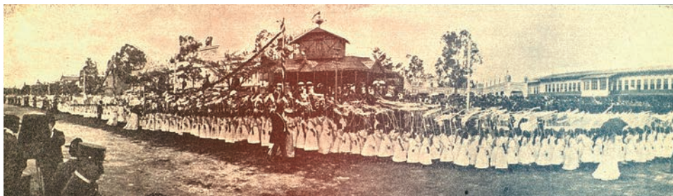
Fig. 3. «Desfile de los colegios de señoritas», La Locomotora , vol. 1, núms. 12-15. Guatemala, 28 de octubre de 1906, p. 35

amazonas. 43 Ahora bien, ¿en qué pudo haber influido la omnipresencia de la diosa Minerva en las mujeres guatemaltecas? La respuesta debe encontrarse en la potencial performatividad de las Minervalias .