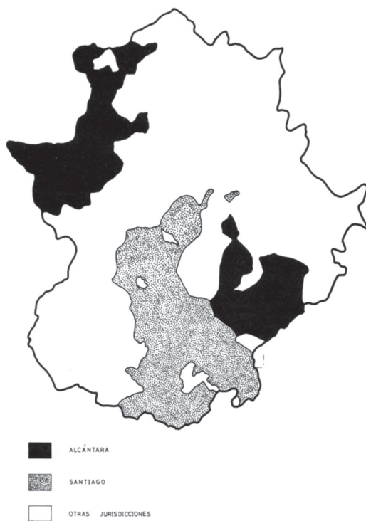
FIGURA 7. Órdenes militares en Extremadura en el siglo XVI 354