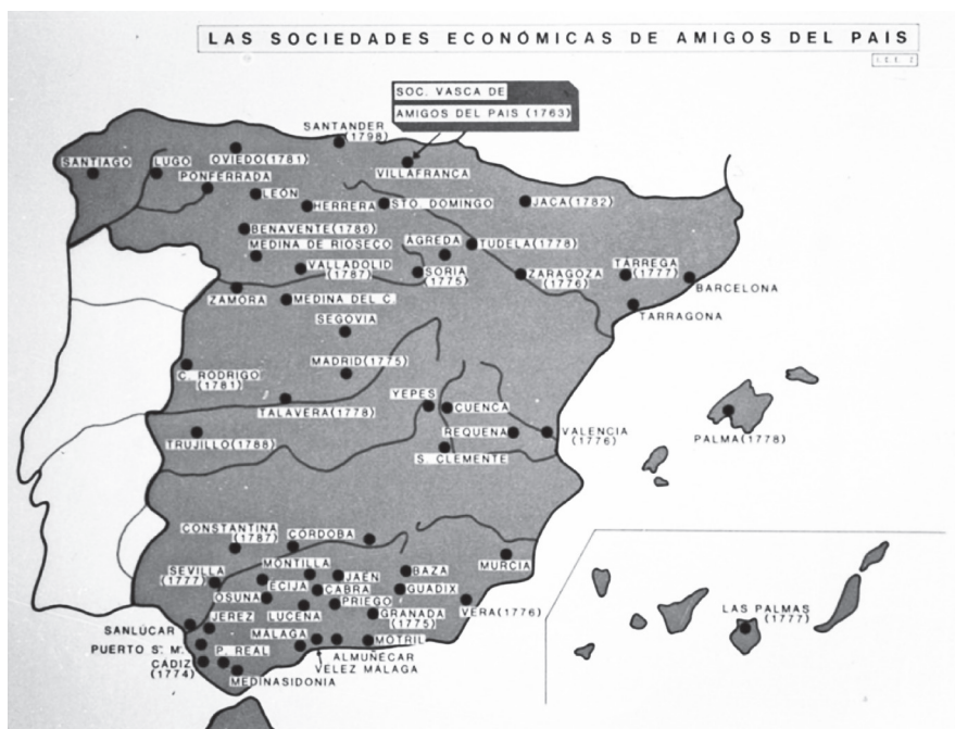
FIGURA 6. Las sociedades económicas de Amigos del País 336

técnicas. Esto hace que, en ocasiones, su creación sea apoyada —e incluso iniciada— por las instituciones públicas.