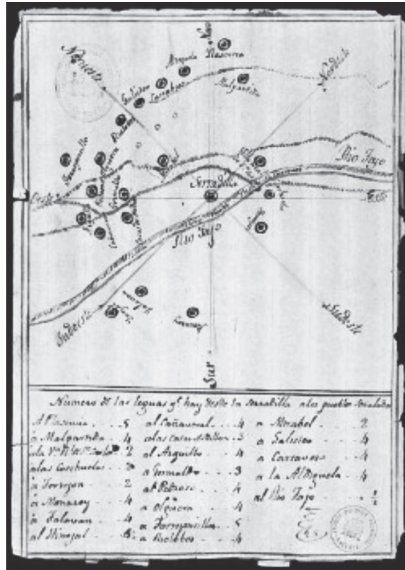
FIGURA 4. Mapa topográfico de Serradilla 247

yeran mapas de la zona cuando se considerase conveniente, al modo del que insertamos a continuación: